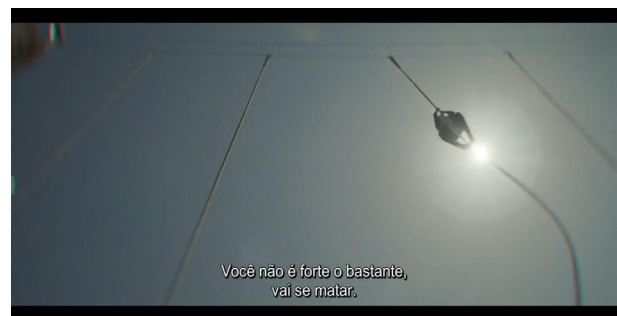
Figura 2- Representa o momento em que ela está se exercitando na força Aérea.