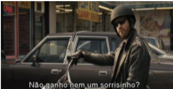
Figura 6 - Ele volta a falar com ela, tendo em vista que não obteve nenhuma resposta.