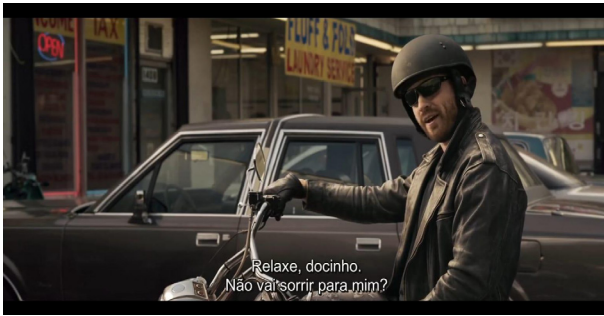
Figura 4- Capitã Marvel é abordada por um motociclista na rua.