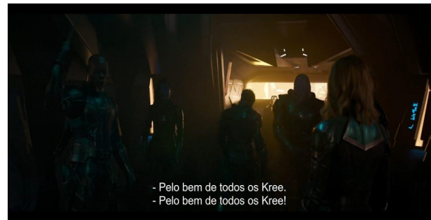
Figura 1- Saída dos Kree para a guerra.

No presente filme da Capitã Marvel, percebe-se no começo a personagem Carol sendo já controlada psicologicamente pelo Yon- Rogg, que faz parte dos Kree (um grupo perverso), ele tenta persuadi-la para fazer só o que ele quer; é a figura masculina transmitida como aquela que vem impedir a personagem de ter acesso a toda sua potencialidade, que a influencia para um lugar de insuficiência, mediocridade e alienação, na cena abaixo Carol embarca em uma missão com os Kree, que são os vilões, sendo influenciada para agir e usar seus poderes conforme a ordem de Yon, em que estava sendo dominada, o filme inicia nesse espaço: