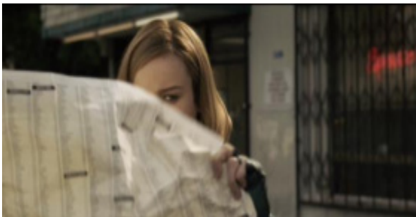
Figura 5- Ela para de ler o jornal e olha para o homem com indiferença e desprezo.