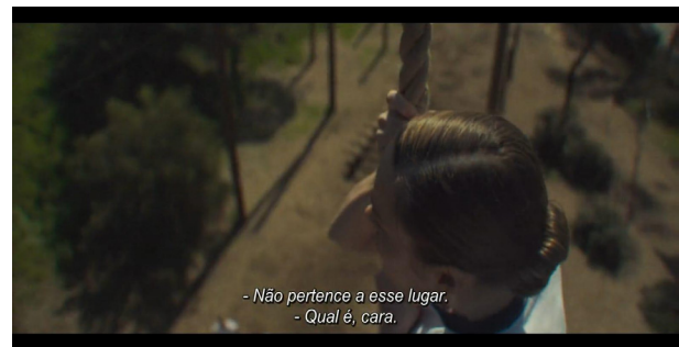
Figura 3- Situação em que ela escuta a fala dos homens da força aérea sobre ela está nesse local.